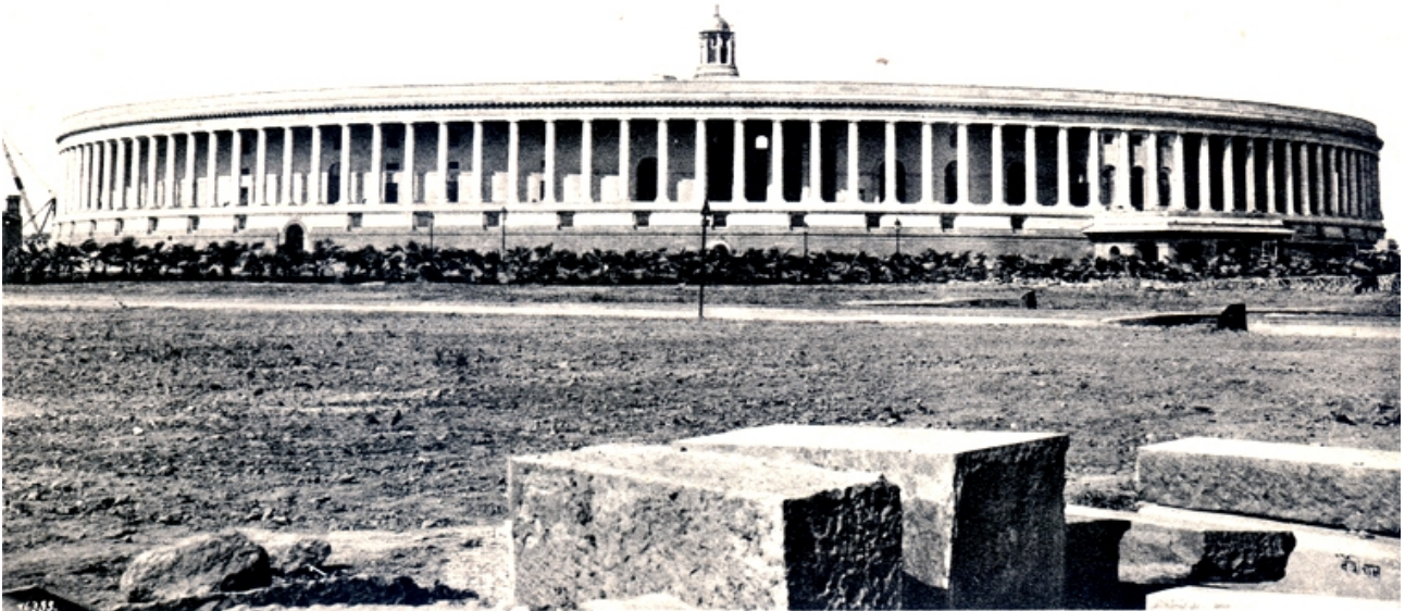
The Indian Parliament, New Delhi

godt sympatisere med dem, men hjælpe dem kan jeg ikke, selvom det stod i min magt, fordi jeg vil forlange deres hjælp til at løfte disse stakler op af sumpen. Og uden deres hjælp vil det ikke lykkes.