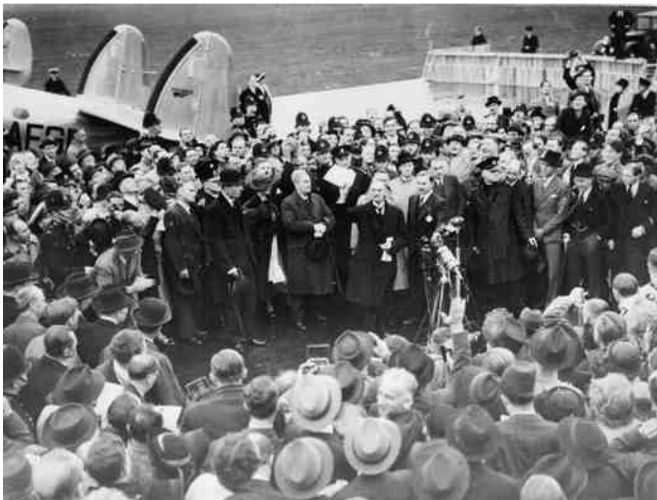
Fred i vor Tid / Peace in our Time Speech given in Defense of the Munich Agreement, 30. september 1938

Vægrer man sig ved at tro, at Politik drives på den Måde, har de demokratiske Statsmænd jo selv leveret Beviset. Havde de virkelig stået lige foran Udbruddet af en Verdenskrig, havde de vel næppe ladet en af deres mægtigste Allierede blive udenfor, som England og Frankrig gjorde over for Rusland. Og hvor kunde det desuden være sandt både at Verdenskrigen stod for Døren og at Tjekoslovakiet vilde komme til at stå fuldstændig alene, hvis det havde forsvaret sig. Det kunde i så Fald aldrig blive noget andet end en lokaliseret Krig som i Spanien, der hverken havde berørt den engelske eller den franske Befolkning direkte. Englands og Frankrigs Andel i Tjekoslovaikiets Underkastelse karakteriserede den konservative Mr. Amery 22 på følgende Måde i Underhuset: „Tjekkerne har vist sig rede til at gøre Indrømmelser, som deres tyske Landsmænd med Glæde havde taget imod — hvis de havde fået Lov til det.”