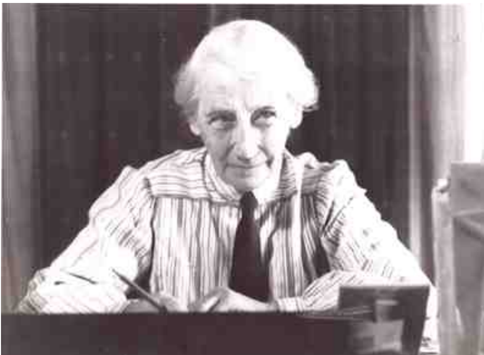
Posse-Brazdowa, Amelie: Ned med vapnen!: En kampsignal mot kriget. Särtryck ur Tidevarvet, 1935.